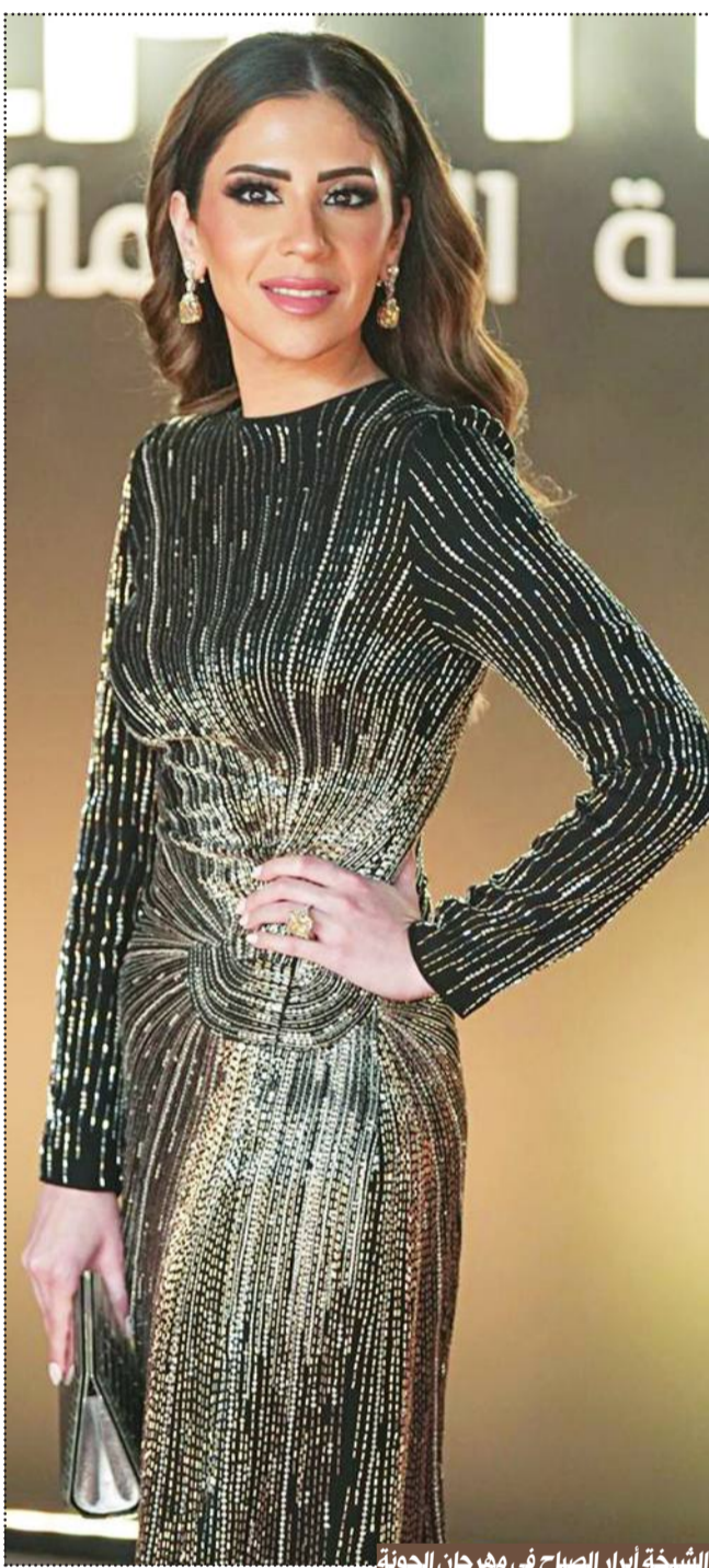
الشيخة أبرار الصباح في مهرجان الجونة