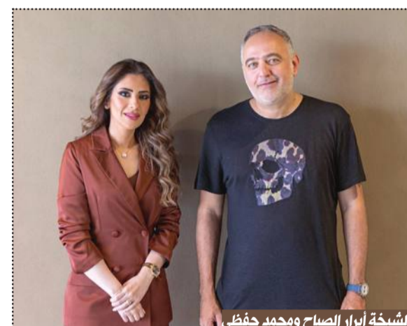
الشيخة أبرار الصباح ومحمد حفزي

مناقشاتنا الأخيرة مع الشيخة أبرار على التزامنا بهذه المهمة. وأضاف نحن نؤمن بأن التعاون مع كبار اللاعبين في صناعة الإعلام والترفيه يسهم في تعزيز النسيج الثقافي لمنطقتنا والمساهمة في نمو صناعة السينما ولدينا الفرصة لتطوير ورفع مستوى صناعة السينما، كجزء من إيماننا بمهرجان الجونة السينمائي «السينما من أجل الإنسانية».